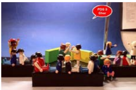
Jede Szene hat Zilic vorab mit kleinen Figuren nachgestellt und fotografiert.

Am heimischen Computer hat der ehemalige Tänzer der Staatsoper Hannover Szene für Szene durchgespielt, denn es ist kein Pappenstil, die Auf- und Abgänge eines Chores mit mehr als 200 Mädchen sinnvoll in Szene zu setzen und dabei auch noch alle praktischen Bestimmungen von Brandschutz bis zur optimalen Sicht des Publikums zu berücksichtigen. Und so wurde schließlich der Bühnenaufbau in der Mitte des Saales platziert und die Zuschauer saßen von beiden Seiten drum herum. Ein längliches Podest, darauf zwei bewegliche, raumteilende Elemente, viel mehr brauchte es nicht für Milos Zilic, den Chor und die Solisten zu einer klaren szenischen Lösung.