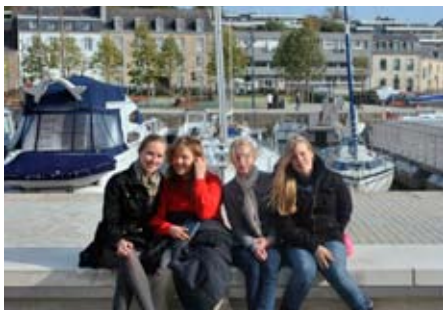
Die Stimmung bei der Konzertreise war großartig – auch in den Pausen!